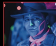
Animación y Post Videoclip Pa' olvidarme de ella Gana Pantalla de Cristal