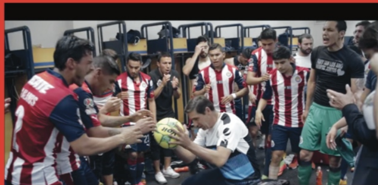
Chivas La Película 5 Nominaciones 3 Premios Pantalla de Cristal