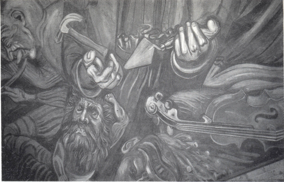
Printura de JOSE CLEMENTE OROZCO.

goce estético de primer orden (17). Ejemplo de ello son las transmisiones televisadas con cortes comerciales a todo el mundo de la Guerra de Vietnam, la Guerra de la Islas de las Malvinas, las hambrunas en Somalia, en África, la Guerra del Golfo Pérsico y las masacres de Sarajevo, sin inmutarnos como espectadores.