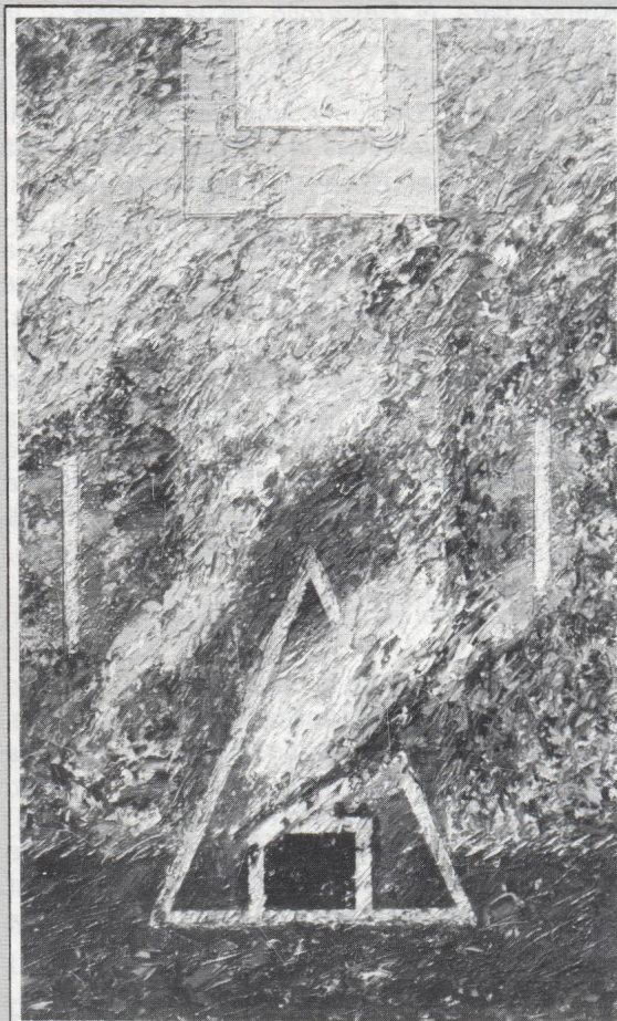
Pintura y Fotografía de SALVADOR CASTRO DE LA ROSA

Dicha fusión se logró cuando los expertos europeos en fusión nuclear emplearon en un reactor deuterio y tritio consiguiendo temperaturas de 300 millones de grados celsius, es decir, 20 millones más que la temperatura del sol, para lograr dicho resultado. Se logró la Fusión Nuclear en Laboratorio, Excélsior , 12 de noviembre de 1991.