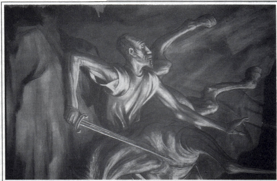
Pinure de GABRIEL FLORES. Fotografía de Rogelio Vázquez Delgado

Es por ello, que hoy en día es central trabajar para romper el círculo de esta enfermedad espiritual al generar otra globalización cultural que cree un cambio de conciencia para sobrevivir y produzca un Nuevo Despertar Humano hacia una fase de realización del Hombre; o continuaremos caminando por el sendero del sueño de la muerte por el que venimos acercándonos como civilización occidental desde hace décadas.