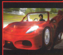
Animación y Postproducción

Kamikaze y Terciopelo ganaron Pantalla de Cristal por Anuncio Halls / Contrata