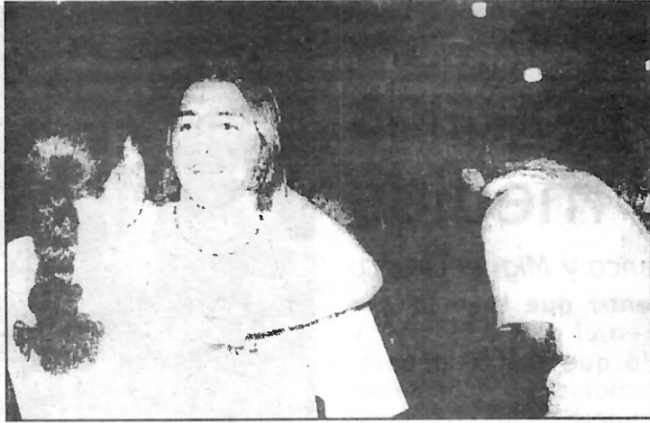
Como pueden observar también se valía bailar al ritmo de la banda de Comala.