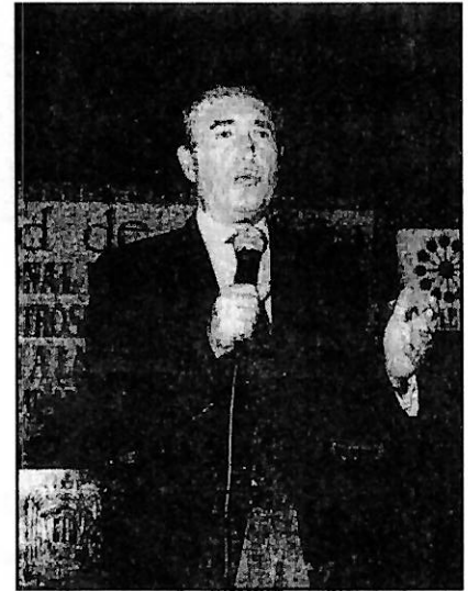
Se pronunció por la privatización de los medios de comunicación.

Y advirtió, que en un futuro los medios de comunicación en "un efecto pendular" tratan de acomodarse para llegar, a algo se pretende pero que nunca se