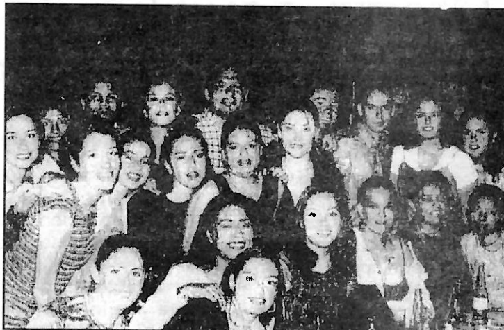
Lástima que por motivos de espacio no pudimos sacar todas las fotos de "Argenta", pero les mostramos a los de la Universidad del Bajío, de León.

El Encuentro en general fue diferente, conocimos personas de otros estados y sus puntos de vista, tratados con expertos reconocidos por trayectorias académica y laboral.