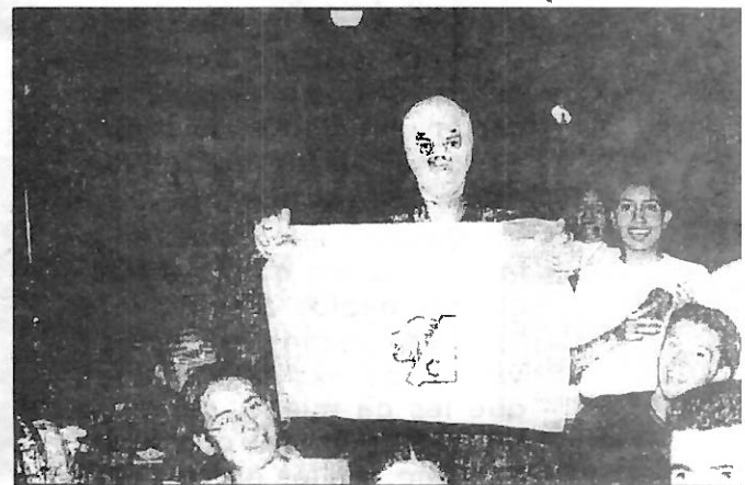
Todos los de León aclamaban a "El Santo", durante la verbena en el jardín libertad.