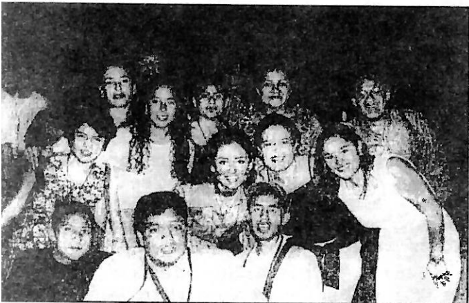
Desde San Luis Potosí, nos encontramos a estos niños que como pueden ver están algunos "happy".